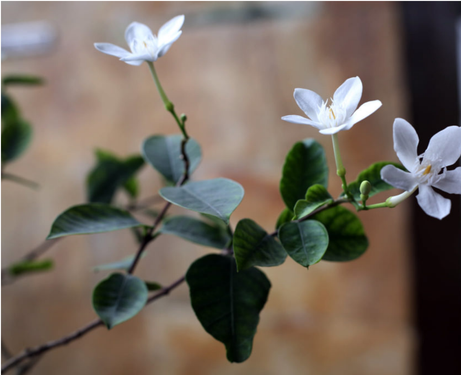
IMG_7901.jpg Foto Bunga dengan Komposisi Leading Line[/caption]

Untuk menghasilkan foto seperti ini, Foto Ke-2, foto Bunga) saya menggunakan teknik :