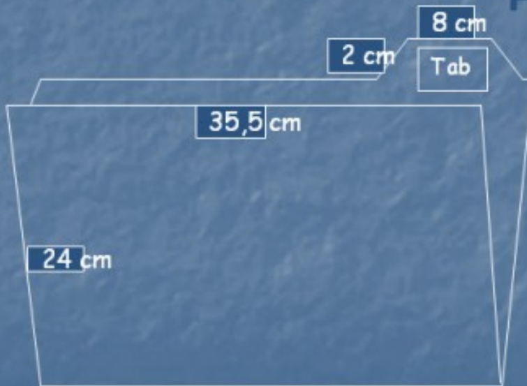
Folder dengan tab di atas