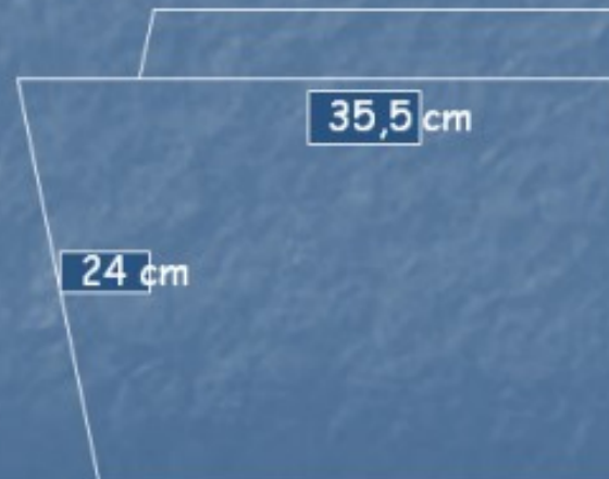
Folder dengan tab di samping