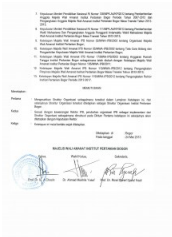
Pengesahan Struktur Organisasi IPB Halaman kedua[/caption]

Tap MWA IPB Nomor 125 Tahun 2013 tentang Pengesahan Struktur Organisasi IPB ini bisa di download dalam bentuk file *.pdf disini: