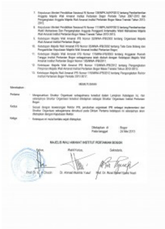
Pengesahan Struktur Organisasi IPB Halaman kedua[/caption]

Tap MWA IPB Nomor 125 Tahun 2013 tentang Pengesahan Struktur Organisasi IPB ini bisa di download dalam bentuk file *.pdf disini: tap_mwaipb_nomor_125_tahun_2013_ttg_pengesahan_struktur_organiasi_ipb.pdf