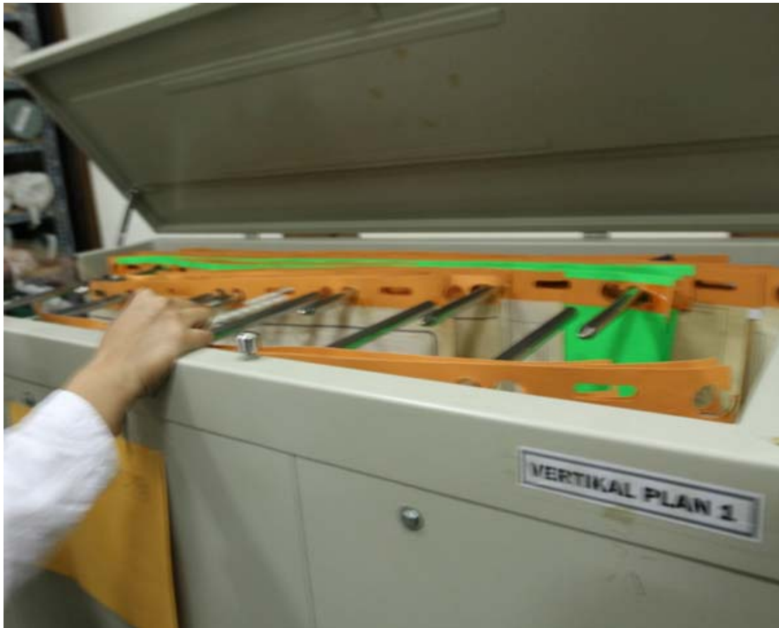
Cara simpan Arsip Statis Kartografi di lemari gantung (Vertikal Plan)