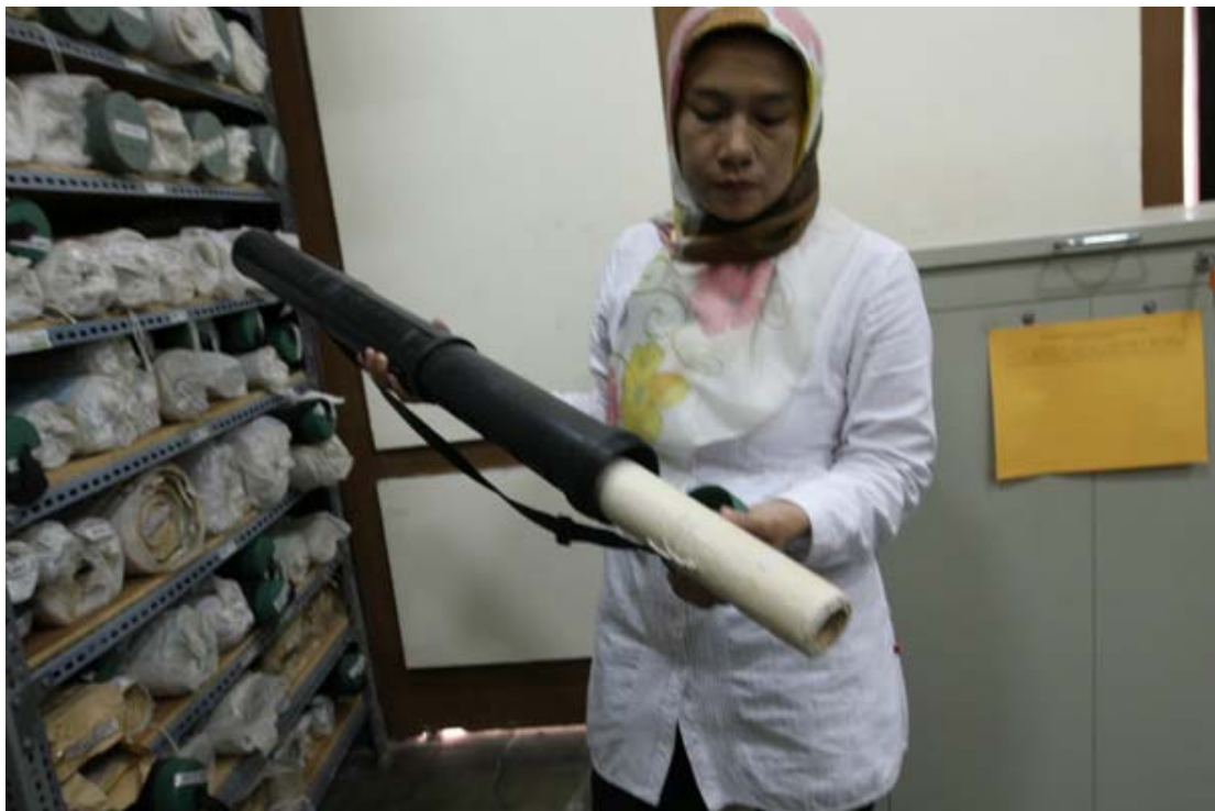
Cara simpan Arsip Statis Kartografi di Tabung/Pipa Kartografi