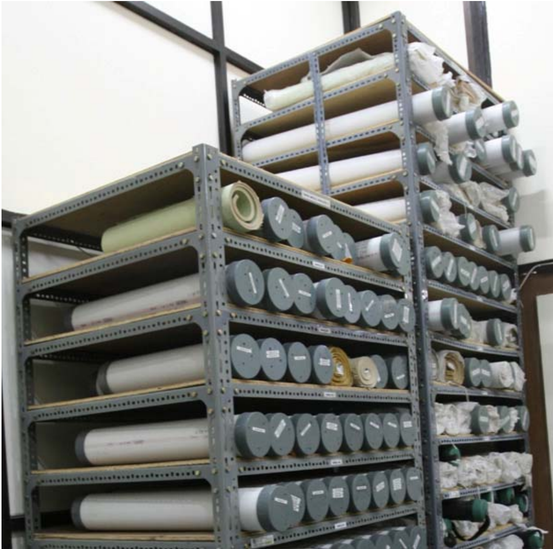
Cara simpan Arsip Statis Kartografi di Tabung/Pipa Paralon (lebih murah biayanya)