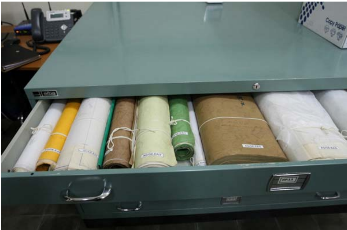
Cara simpan Arsip Statis Kartografi di lemari