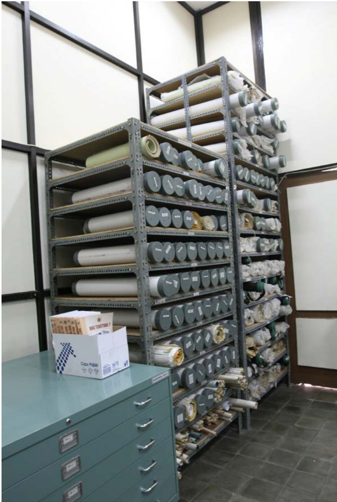
Cara simpan Arsip Statis Kartografi di Lemari dan Pipa