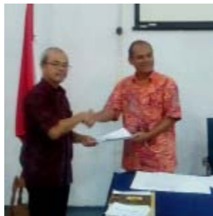
Bersalaman tanda setuju menjadi pelanggan SIKN/JIKN

Bentuk surat kontrak berlangganan Could Storage nya Telkom seperti ini: